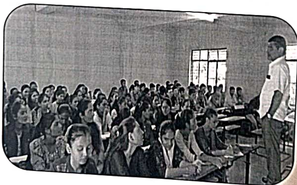
Participant of the Programme